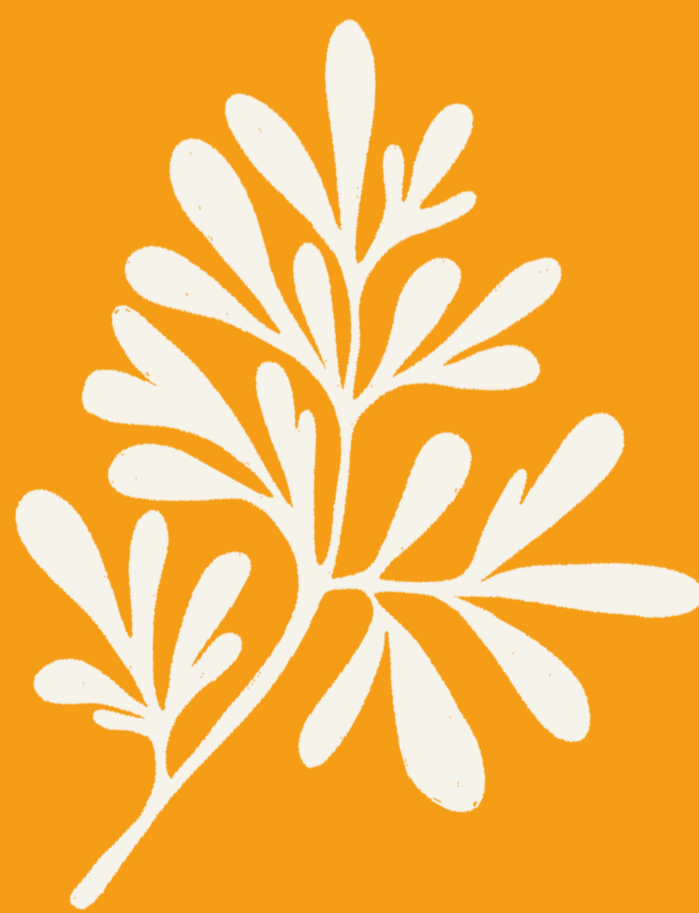
ARRUDA Ruta graveolens