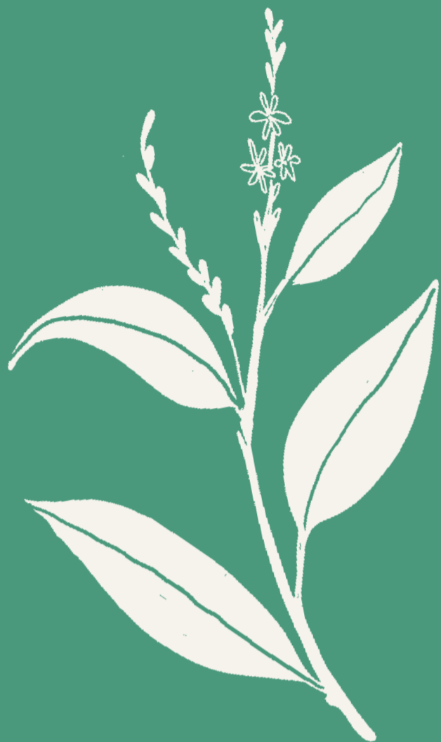
GUINÉ Petiveria alliacea