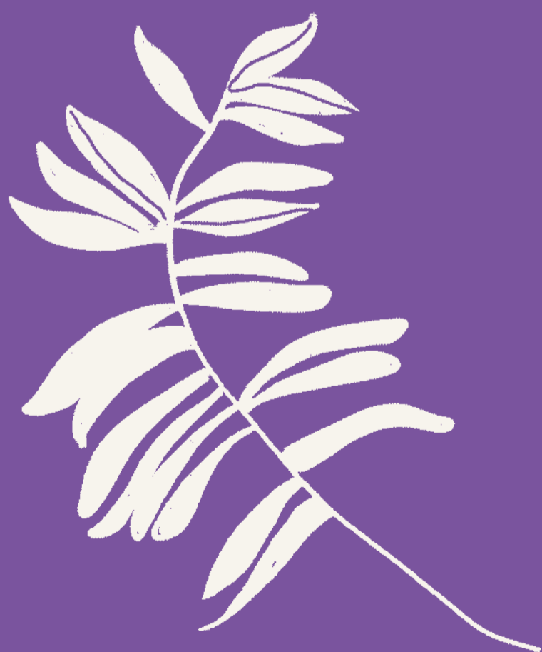
SALVIA Salvia officinalis