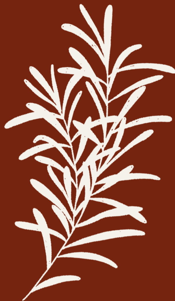
ALECRIM Salvia rosmarinus